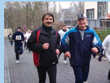
Sport: Nicht nur als Zuschauer mit Herz dabei