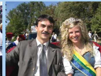
Einer von uns: Im Landkreis fest verwurzelt