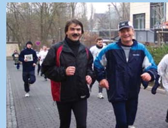
Sport: Nicht nur als Zuschauer mit Herz dabei