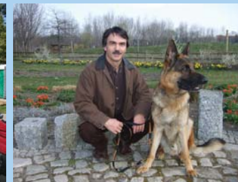
Freizeit: Interesse für Natur und Garten