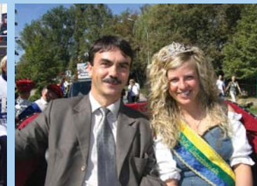
Einer von uns: Im Landkreis fest verwurzelt