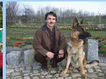
Freizeit: Interesse für Natur und Garten